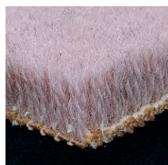
SW-101 (国土交通省仕様 A 種)