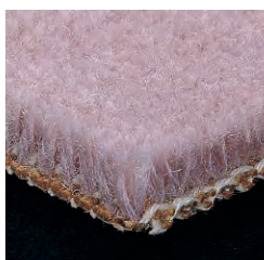
SW-106 (国土交通省仕様 C 種)