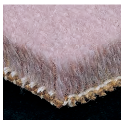
SW-105 (国土交通省仕様 B 種)